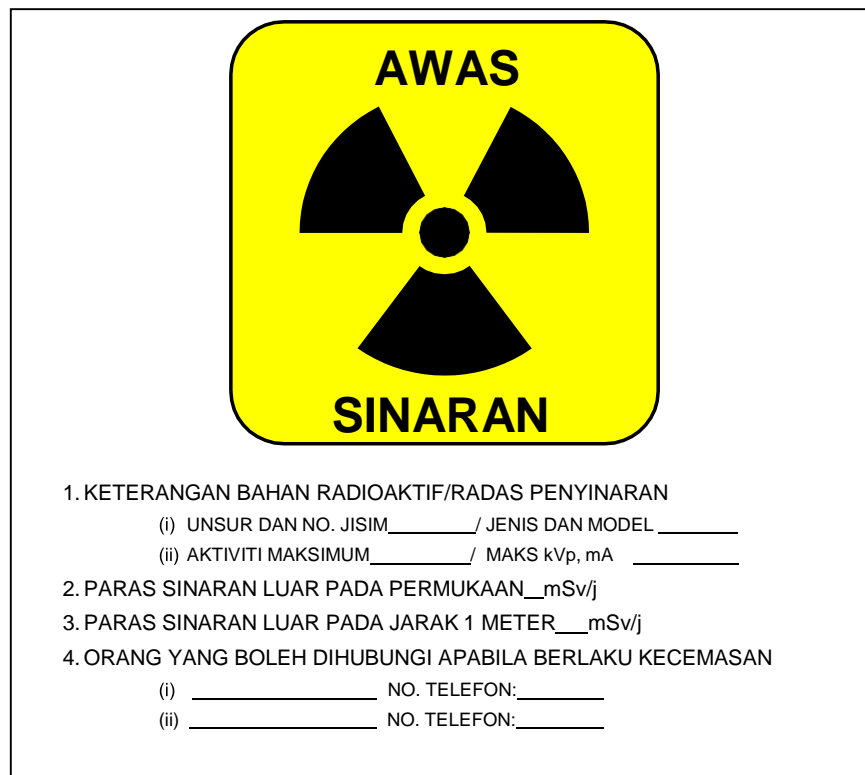
Rajah 2: Notis dengan tanda amaran, simbol sinaran berserta maklumat peralatan sinaran.