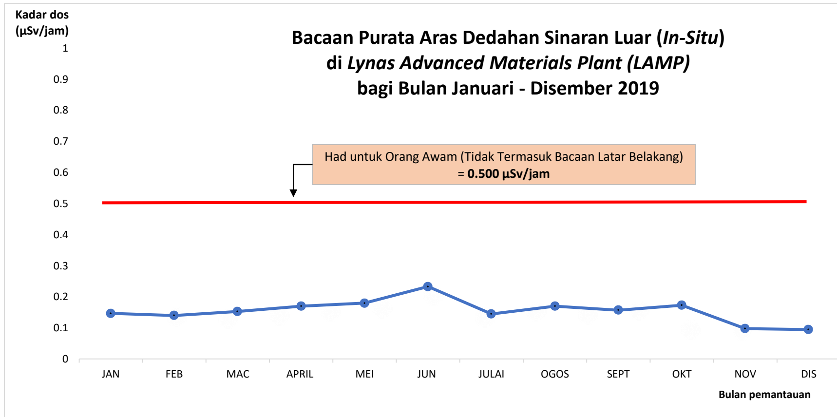
Rajah 1: Bacaan purata bagi aras dedahan sinaran luar ( In-Situ ) di Lynas Advanced Materials Plant (LAMP) bagi bulan Januari – Disember 2019.